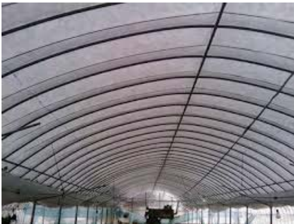
写真 32 屋根面に着雪し、融雪が必要となっているハウスの状況