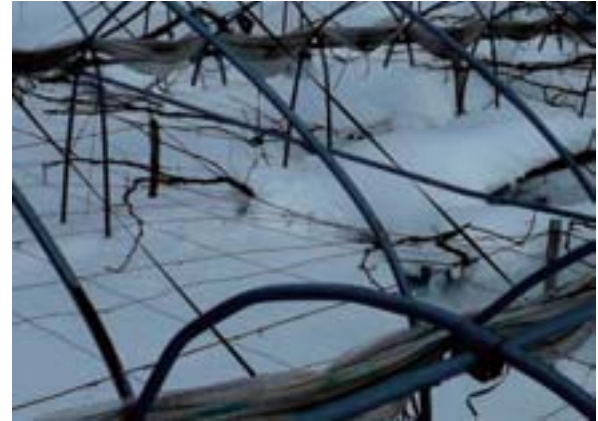
写真 28 棚下と棚面に積もった雪が つながり、雪下ろし、雪踏み が必要な状態