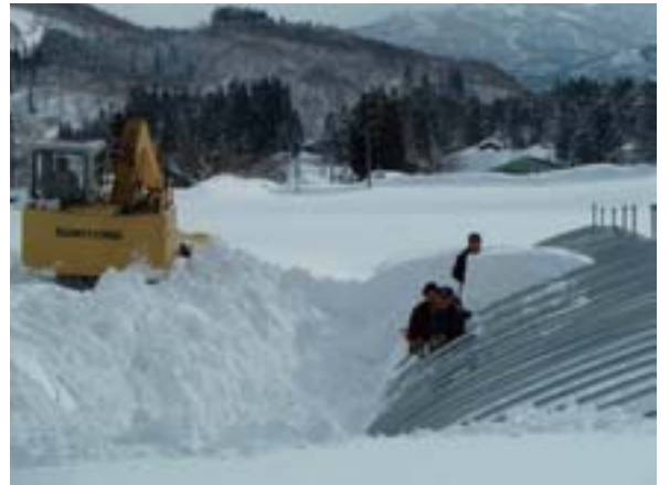
写真 24 グループ作業による除雪の状況