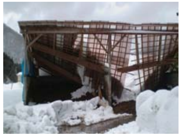
写真 38 堆肥舎屋根の損壊状況