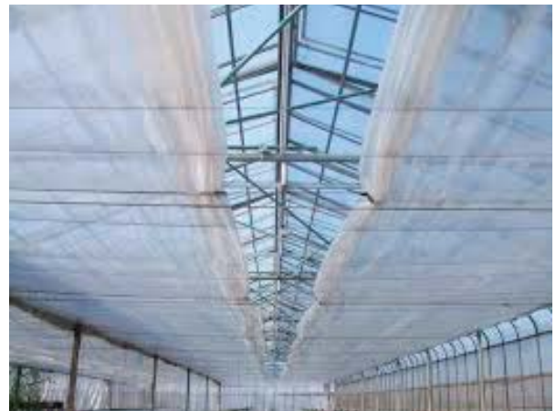
写真 33 内張りカーテンを開放し、屋根面の融雪を促す