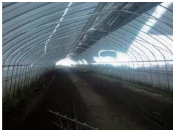
写真 34 無加温ハウスで、ハウス密閉により屋根面の雪が滑落している状況