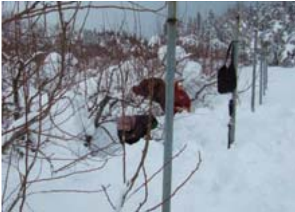
写真 27 西洋なしの枝の掘り上げ状況