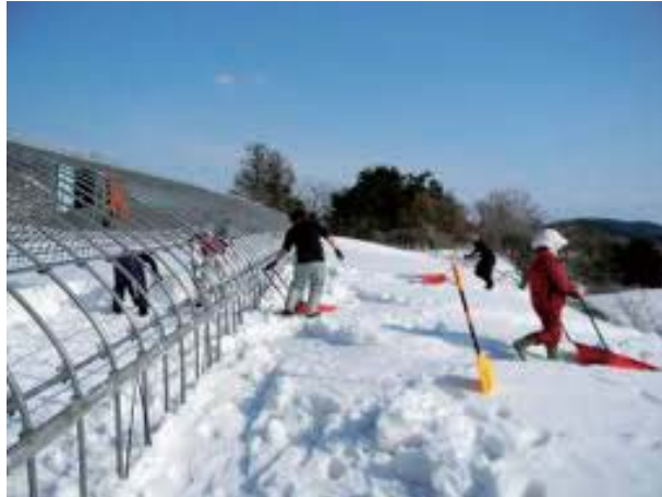
写真 35 被覆資材を除去した ハウスの除雪の状況