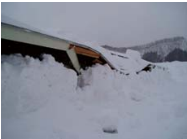
写真 37 畜舎軒先の損壊状況