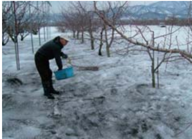
写真 31 融雪剤の散布は40kg/10a程度を目安とする(P.19 表3参照)