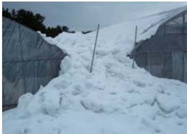
写真36 積雪がハウスの肩まで達し、 早急に除雪が必要な状況