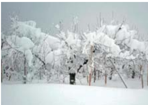
写真 25 りんごへの積雪 雪下ろしが必要な状態