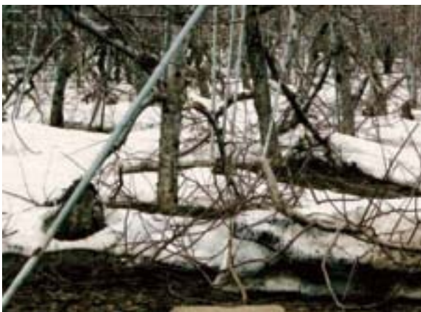
写真 29 沈降力により折れたりんご の枝