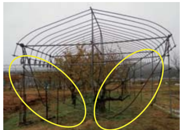
写真 30 沈降力により変形した筋交い パイプ