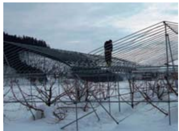
写真 26 おうとう雨よけ施設の雪下ろし作業の状況