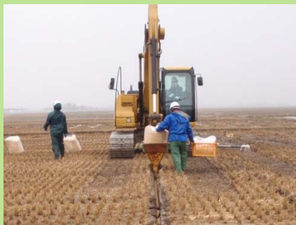
地下かんがい(補助孔)