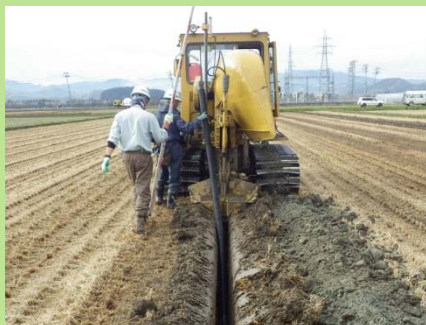
地下かんがい(給水渠)

山形県では、転作田で、大豆やそば、園芸作物等に取り組む農家のみなさんのために、地下かんがい施設等の基盤整備や排水改良等の機材導入を支援しています。