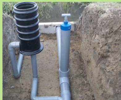
地下水位調整器と水閘