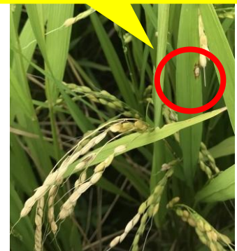
止葉に発生した葉いもち病斑