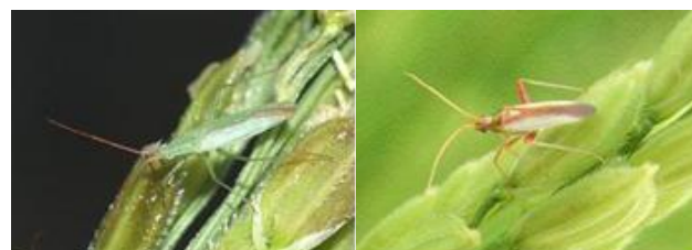
アカヒゲホソミドリカスミカメ アカスジカスミカメ