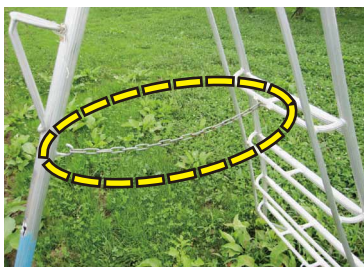
チェーンをしっかり掛ける