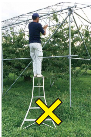
天板(最上段)では作業しない