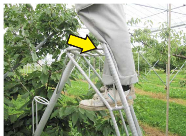
脛や腿を脚立に当てる