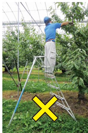
昇降面に背を向けて作業しない