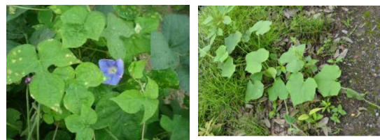
帰化アサガオ (左) アレチウリの葉 (右)

圃場周辺で発見したら、必ず雑草の開花・結実前に手取りや非選択性茎葉処理剤で除去しましょう。