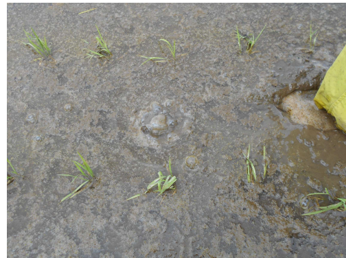
ワキ発生の様子 (5/19撮影)