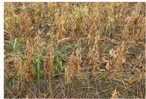
図 里のほほえみ(10/12時点) 落葉は進んでいるが、茎や莢に黄色が残る