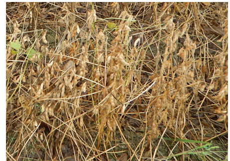
図 エンレイ(10/12時点) 茎・莢ともに褐色となった