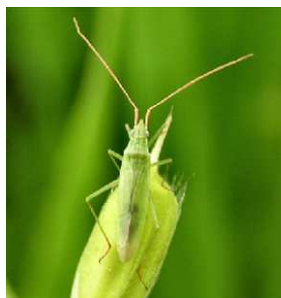
アハゲホトリカスミカメ