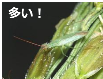
アカヒゲホソミドリ カスミカメ

○水田内のイヌホタルイやノビエはアカスジカスミカメの発生減となるため、残草対策もしっかり行いましょう。※除草剤の使用時期を確認し、使用しましょう。