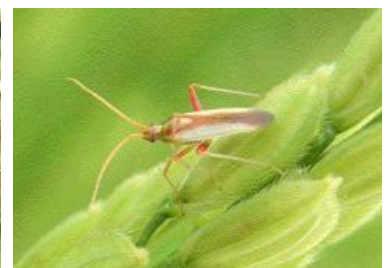
アカスジカスミカメ