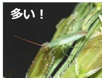
アカヒゲホソミドリ カスミカメ

○水田内のイヌホタルイやノビエはアカスジカスミカメの発生減となるため、残草対策もしっかり行いましょう。※除草剤の使用時期を確認し、使用しましょう。