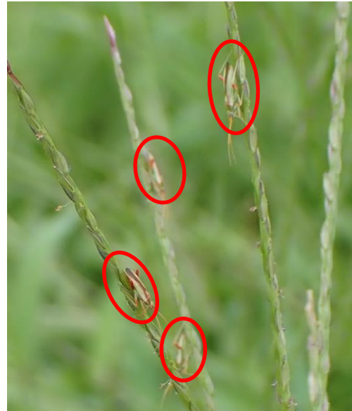
写真2 メヒシバの穂に多数寄生するアカスジカスミカメ