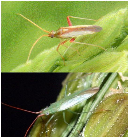
写真1 上: アカスジカスミカメ 下: アカヒゲホソミドリカスミカメ