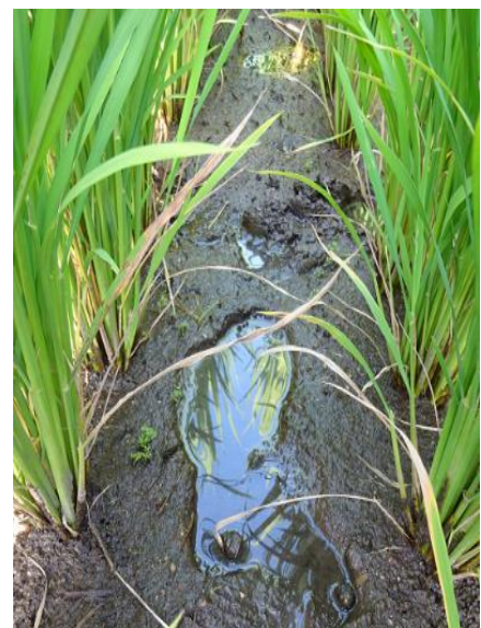
写真 飽水管理の様子

湛水せずに土壌を常に湿潤状態に保つ水管理。浅水程度に灌水し、自然落水で足跡に水が残る程度(右写真)になったら再度灌水することを繰り返す。