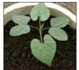
写真 マルバアサガオ(幼植物)