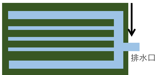
図2 明渠と排水口のつながり