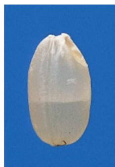
図2 胴割粒

今後の天候は周期的に変わり、降雨日も増えると予想されます。気温や風の状況によっては、降雨後であってもイネが乾き、刈取作業が可能になる場合もあります。晴れ間をぬって効率的かつ積極的に作業を進めましょう。