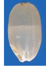
図1 胴割粒