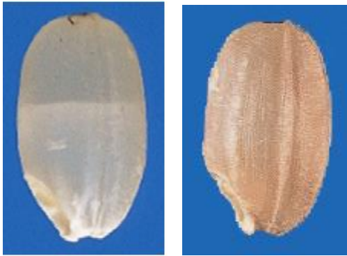
図1 左：胴割粒 右：着色粒 (農林水産省HP)