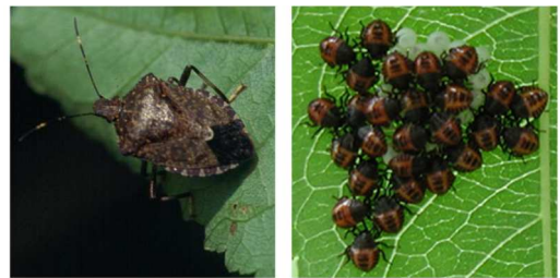
クサギカメムシ(左:成虫、右:幼虫、卵)