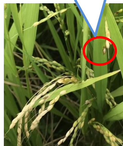
止葉に発生した葉いもち病斑