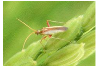
アカスジカスミカメ