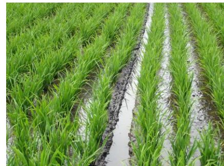
中干し後の作溝をした圃場

斑点米カメムシ類は、発生予察情報では発生量が“ やや多い ”予想です。 畦畔と圃場周辺の除草と水田内の雑草対策(ヒエ、ホタルイ)を徹底しましょう! 水田内で葉いもちの発生が確認されています。圃場を観察し、 早期に発見・発生初期に防除を!