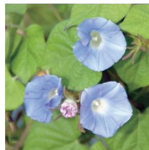
マルバアメリカアサガオ