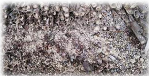
何年使用したか分からない古いヨシ巢