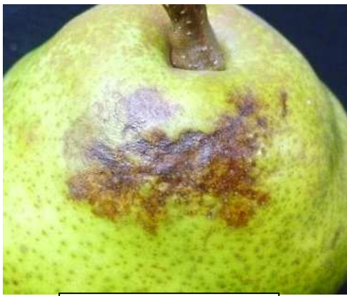
胴枯病の初期病斑