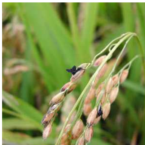
写真1 立毛状態での様子

墨黒穂病は汚損粒として落等する原因になります 発病した粳の汚損が粳摺り機等に付着し、健全粳に汚損が拡大します