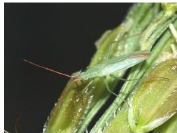
アカヒゲホソミドリ カスミカメ

斑点米カメムシ類「やや多い」！ 今すぐ草刈りを行い、斑点米カメムシ類の生息密度を減らしましょう！