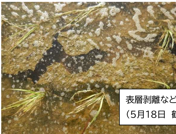
表層剥離などによる浮遊物 (5月18日 鶴岡市藤島)